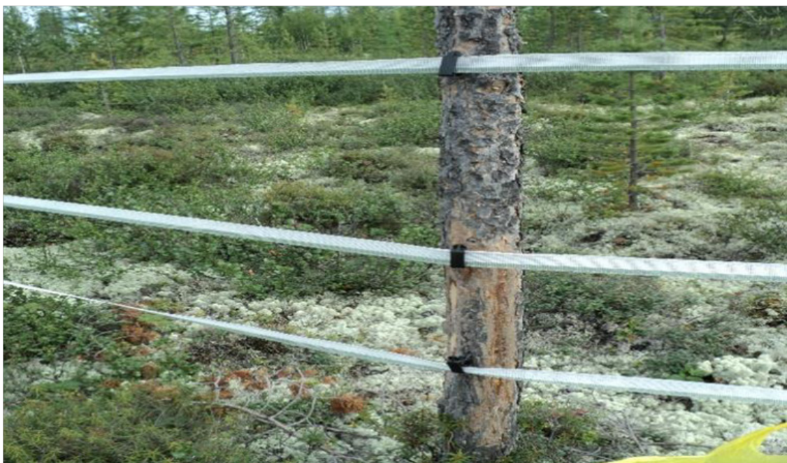
Рис. 2. Электроизгородь. Fig. 2. Electric fence.

Особенности современного применения изгородей в оленеводстве. Основными объектами изгородного оленеводства являются домашние северные олени, огороженный пастбищный участок и хозяйственно-бытовой комплекс (откормочные площадки, корали, убойный и ветеринарный пункты, жилые помещения, склады, бытовые постройки и пр.), то есть все необходимое для выпаса стада, проведения зооветеринарных работ и обеспечения социально-бытовых потребностей оленеводов и специалистов (рис. 3).