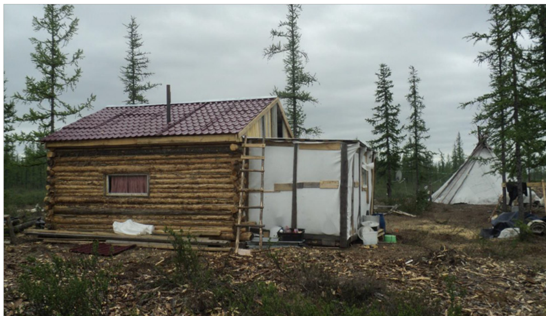
Рис. 3. Жилой дом и чум на производственно-бытовой базе оленефермы. Fig. 3. The living house and tent on the production and household base of a reindeer farm.

Экономический анализ опыта функционирования изгородных оленьих ферм в Надымском районе убеждает, что данный вид содержания животных позволяет на протяжении многих лет показывать стабильные производственные показатели. Некоторые авторы отмечали, что правильная организация изгородного содержания оленей и рациональная эксплуатация огороженных пастбищ позволяют повысить упитанность животных, значительно сократить непроизводственный отход оленей, качественно проводить ветеринарно-зоотехнические мероприятия (в лесной зоне тундровые олени через несколько лет увеличивают свою живую массу на 1013 кг, убойную массу – на 3–4 кг) [21, с. 98].