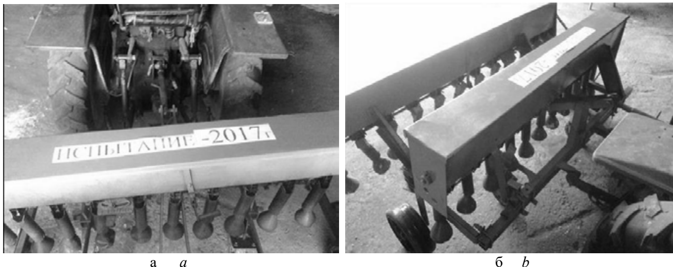
Рис. 2. Опытный образец сеялки травосмесей в агрегате с минитрактором Феншоу-180. а – вид сеялки справа; б – вид сеялки сзади Fig. 2. Experimental sample of a seeder of grass mixes in the unit with minitractor Fenshou-180. а – type of seeder on the right; б – type of seeder behind

сменные звездочки для регулировки нормы высева семян трав.