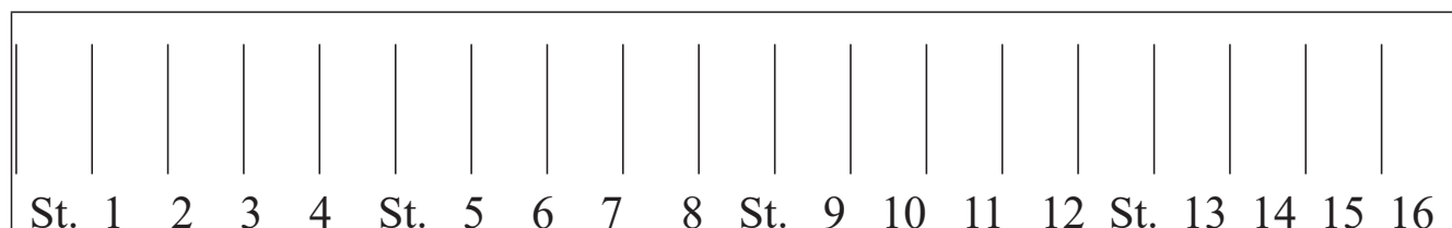
Рис. 1. Схема коллекционного питомника закладки тмина обыкновенного 2017 г. Эндемичные формы – 200 шт. Fig. 1. Scheme of collection nursery for laying Carum carvi 2017. Endemic forms – 200 pcs.