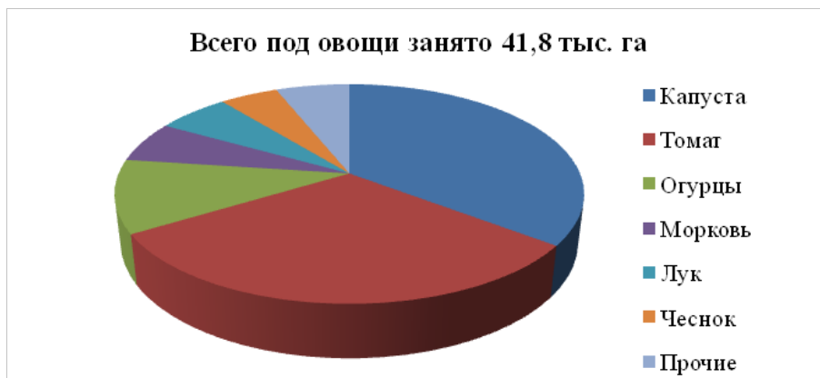
Рис. Структура площадей, занятых под овощные культуры за 2018 год