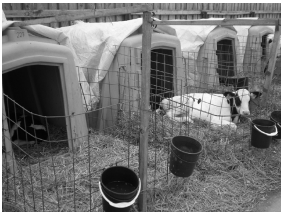
Рис. 3. Содержание телят в индивидуальныхдомиках в условиях умеренно низких температур Fig. 3. Content of calves in individual boxes in conditions of moderate-low temperatures

а) первично вакцинированные (до трехмесячного возраста);