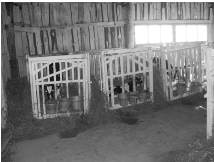
Рис. 4. В профилактории Fig. 4. In the dispensary

ферме, но она не может быть менее десяти суток, а в индивидуальных домиках – не менее двух месяцев. Не допускается содержание в одной клетке (домике) двух и более телят (рис. 4).