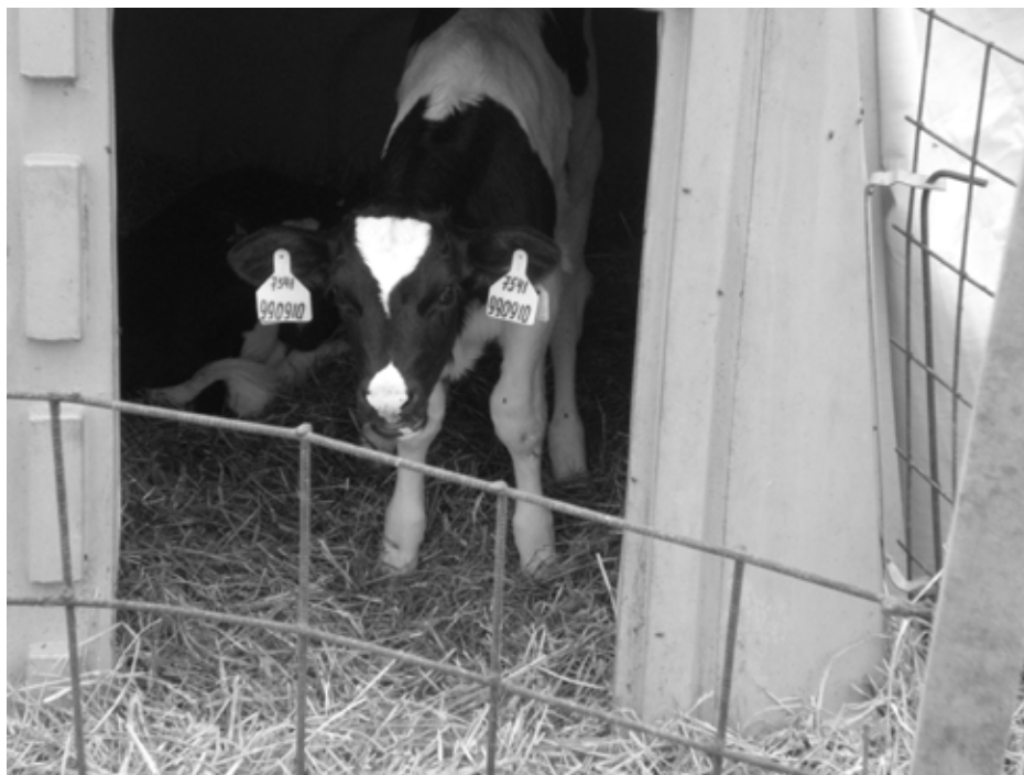
Рис. 2. Индивидуальный домик для теленка Fig. 2. Individual house for a calf