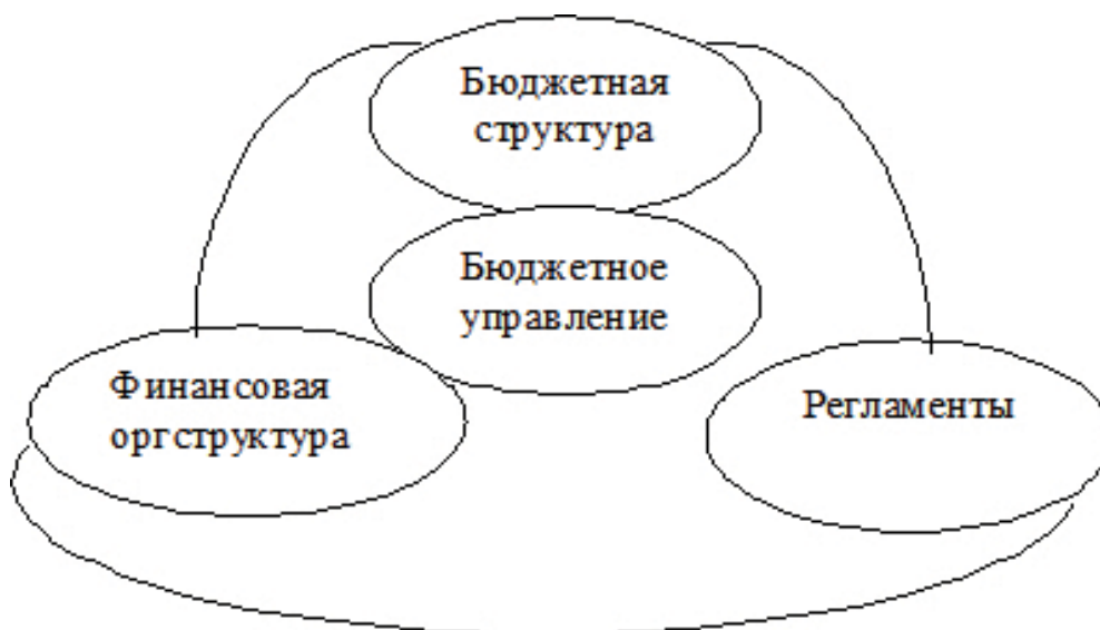
Рис. 1. Бюджетное управление. Структура