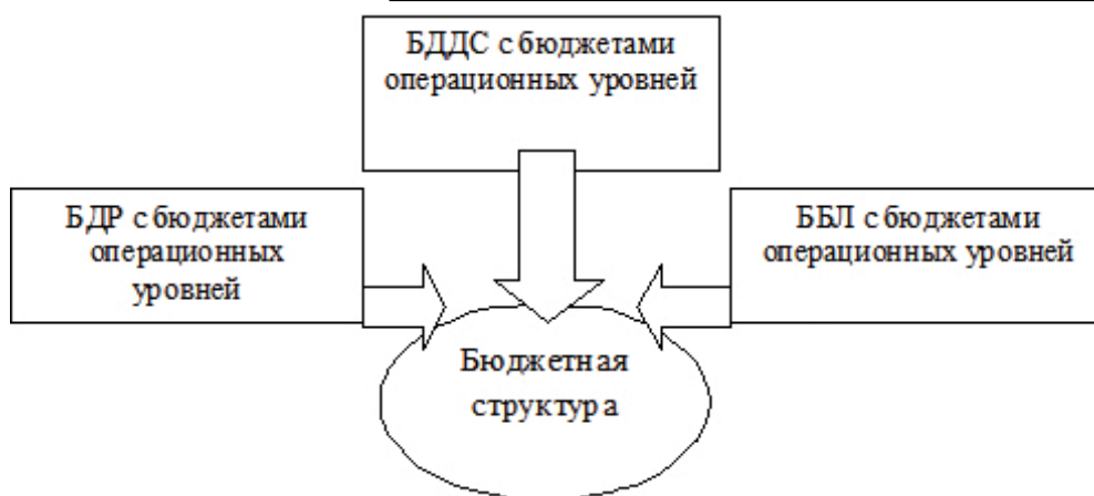
Рис. 2. Бюджетная структура