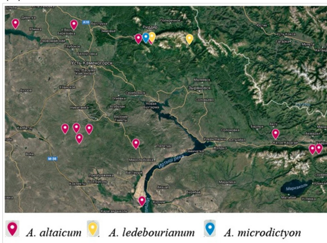
Рис. 1. Места сбора образцов редких реликтовых и эндемичных видов лука на территории Казахстанского Алтая Fig. 1. Places of collection of samples of rare relict and endemic species of Allium in the territory of Kazakhstan Altai

На сегодняшний день существует огромное количество методов исследования ДНК. В настоящий момент представители рода Allium изучаются с использованием различных молекулярных маркеров, таких как RAPD, ISSR, AFLP, SSR. Кроме того, секвенирован пластидный геном лука репчатого A. sepa . Изучена филогения дикорастущих видов Allium с помощью последовательностей ITS и EST [6, с. 260], [7, с. 560], [8, с. 19]. В отличие от вышеупомянутых методов, iPBS-амплификацию ДНК начали использовать относительно недавно. Данный метод заключается в использовании консервативных областей последовательностей PBS сайтов ретротранспозонов как для выявления полиморфизма в профилях транскрипции и клонирования LTR сегментов из геномной ДНК, так и для поиска в базах данных ретротранспозонов. Ввиду того что многие ретротранспозоны являются встроенными в другие ретротранспозоны и инвертированы друг к другу или фрагментированы, они могут быть доступны при использовании консервативных PBS-праймеров в амплификации ДНК для любого вида растений или животного [9, с. 14], [10], [11, с. 923], [12, с. 460]. Это позволяет использовать данный метод в качестве универсального и высокоэффективного метода для прямой детекции полиморфизма. Изучение полиморфизма как генома в целом, так и отдельных генов представляет несомненный научный и практический интерес [13, с. 3].